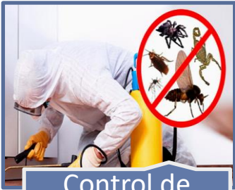
Control de Plagas