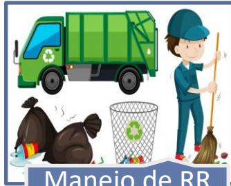
Manejo de RR SS