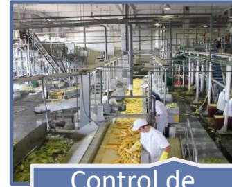
Control de Operaciones