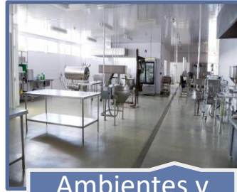
Ambientes y Equipos