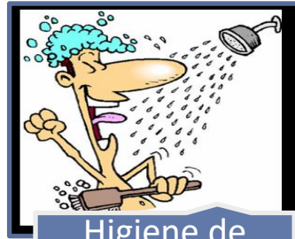
Higiene de Personal